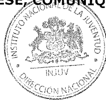
NICOLÁS PREUSS HERRERA DIRECTOR NACIONAL INSTITUTO NACIONAL DE LA JUVENTUD