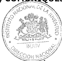
NICOLÁS PREUSS HERRERA DIRECTOR NACIONAL INSTITUTO NACIONAL DE LA JUVENTUD