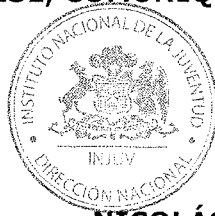
NICOLÁS PREUSS HERRERA DIRECTOR NACIONAL INSTITUTO NACIONAL DE LA JUVENTUD