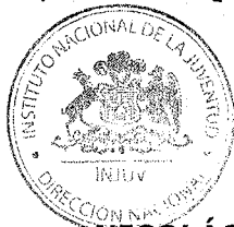
NICOLÁS PREUSS HERRERA DIRECTOR NACIONAL INSTITUTO NACIONAL DE LA JUVENTUD