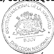
NICOLÁS PREUSS HERRERA DIRECTOR NACIONAL INSTITUTO NACIONAL DE LA JUVENTUD